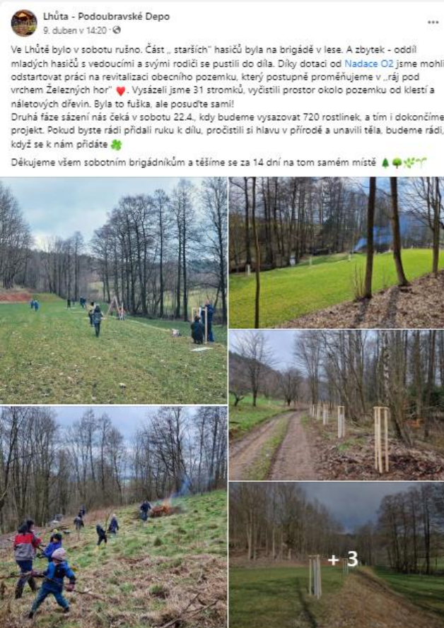
Lhůta - Podoubravské Depo 9. duben v 14:20 · 🌱

Ve Lhůtě bylo v sobotu rušno. Část „starších“ hasičů byla na brigádě v lese. A zbytek - oddíl mladých hasičů s vedoucími a svými rodiči se pustili do díla. Díky dotaci od Nadace O2 jsme mohli odstartovat práci na revitalizaci obecního pozemku, který postupně proměňujeme v „ráj pod vrchem Železných hor“ 🌱. Vysázeli jsme 31 stromků, vyčistili prostor okolo pozemku od kletstí a náletových dřevin. Byla to fuška, ale posuďte sami! Druhá fáze sázení nás čeká v sobotu 22.4., kdy budeme vysazovat 720 rostlinek, a tím i dokončíme projekt. Pokud byste rádi přidali ruku k dílu, pročistili si hlavu v přírodě a unavili těla, budeme rádi, když se k nám přidáte 🌱